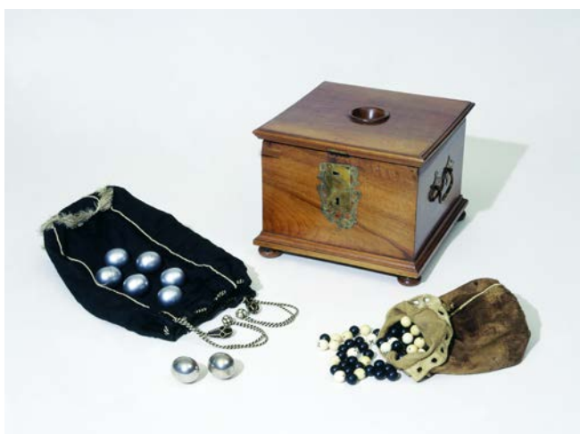
Instruments utilisés à Bâle pour tirer au sort certaines magistratures au XVIII e siècle, © Historisches Museum Basel, photo: M. Babey.